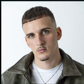
LUCAS PERON Réalisation & Montage